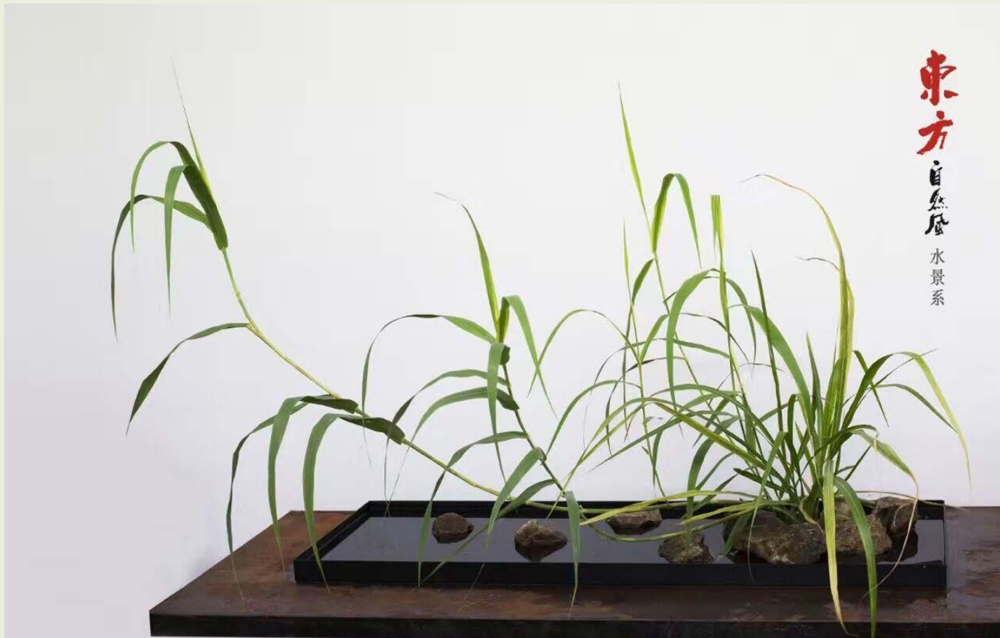
单一花材的多样统一