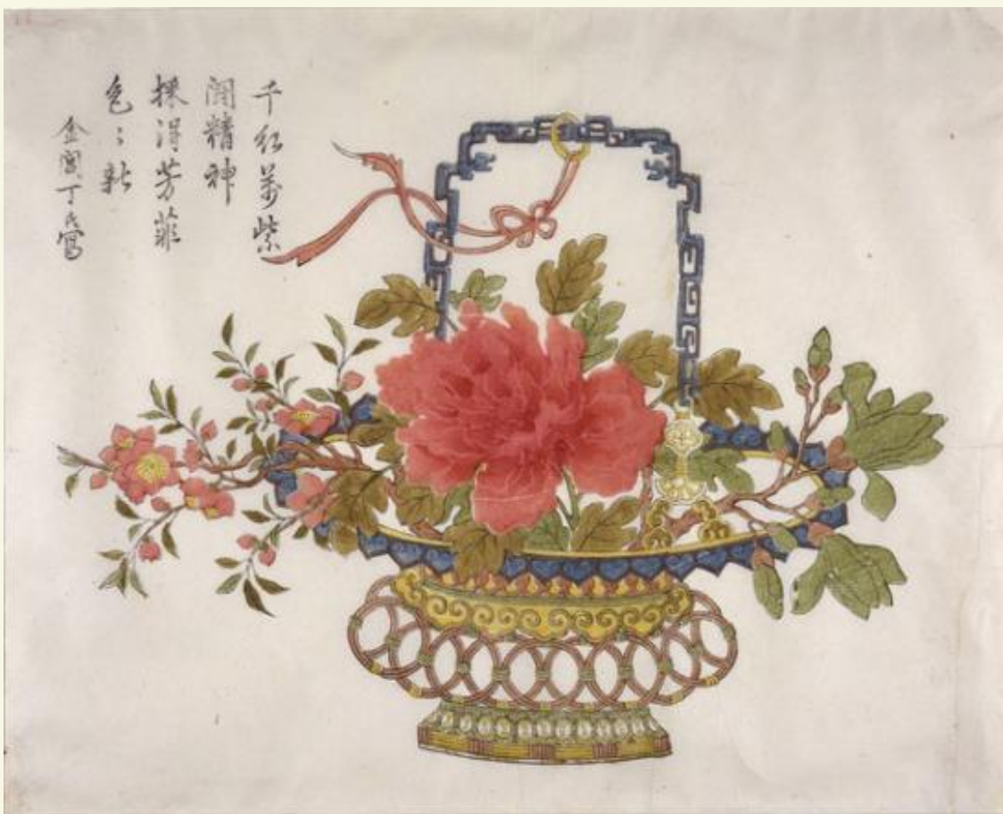
清代，丁亮光，三月蓝花