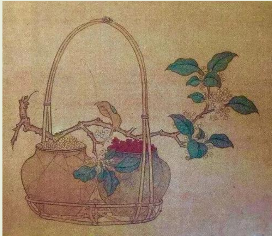
《吊篮式自由花》 元 钱选