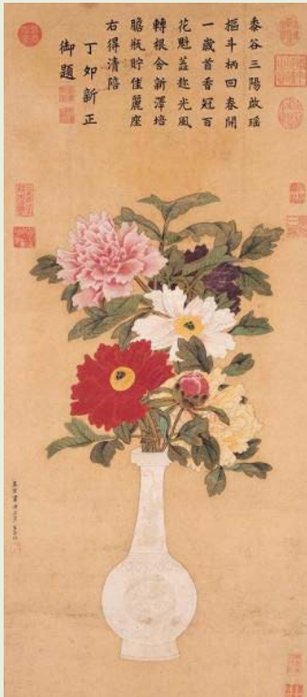
《太平春色》 元 张中

1271 ~1368年的元代，受朝代更迭的影响，插花艺术发展缓慢并收缩，陷入低谷。仅在宫廷及文人中流行，一般平民百姓少有此闲情逸致