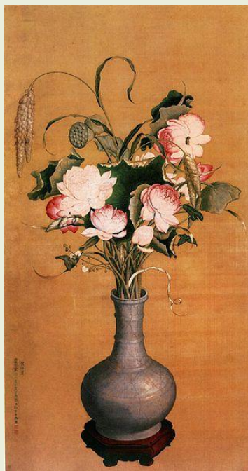
《聚瑞图》 清 郎世宁