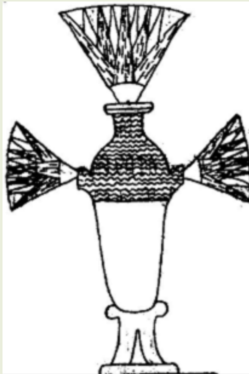
贝尼哈桑墓壁的睡莲壁画