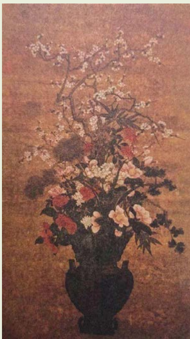
《太平春色》 明 孙克弘

1368 ~ 1840年的明朝清朝，插花艺术系统发展。多部专著问世，比如袁宏道《瓶史》；高濂《瓶花三说》；张德谦《瓶花谱》；沈复《浮生六记·闲情记趣》；陈淏子《花镜·养花插瓶法》等