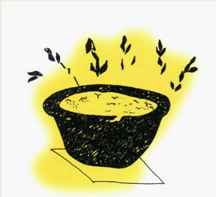
东汉 墓壁画— 六枝 红花

公元前206年～公元589年，汉、魏及南北朝时期，原始容器插花意念的形成和发展。文人雅士们为寻求精神上的寄托与安慰，以山水花草为友，吟诗作画，留下不少脍炙人口的插花诗和画