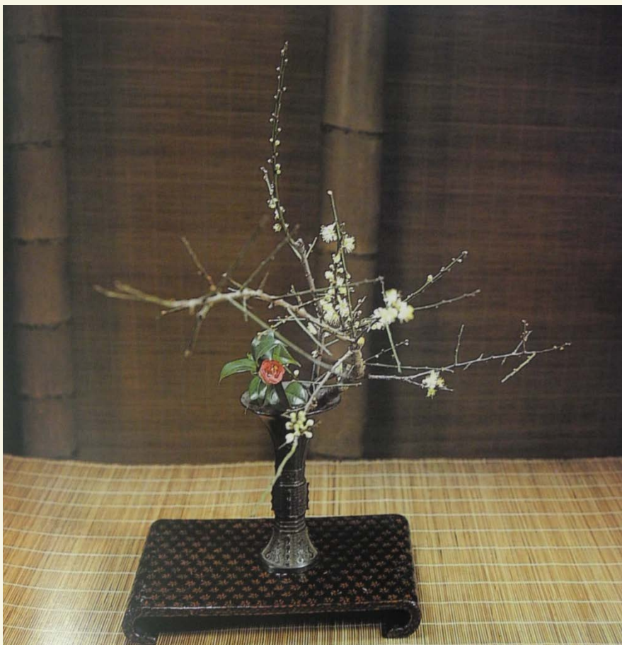
白梅吐新蕊，山茶映雪红