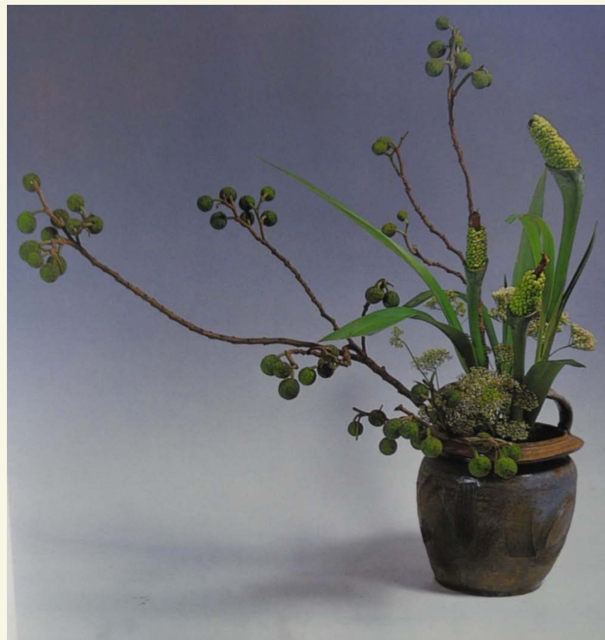
不同的绿，产生深浅不一夏的层次感