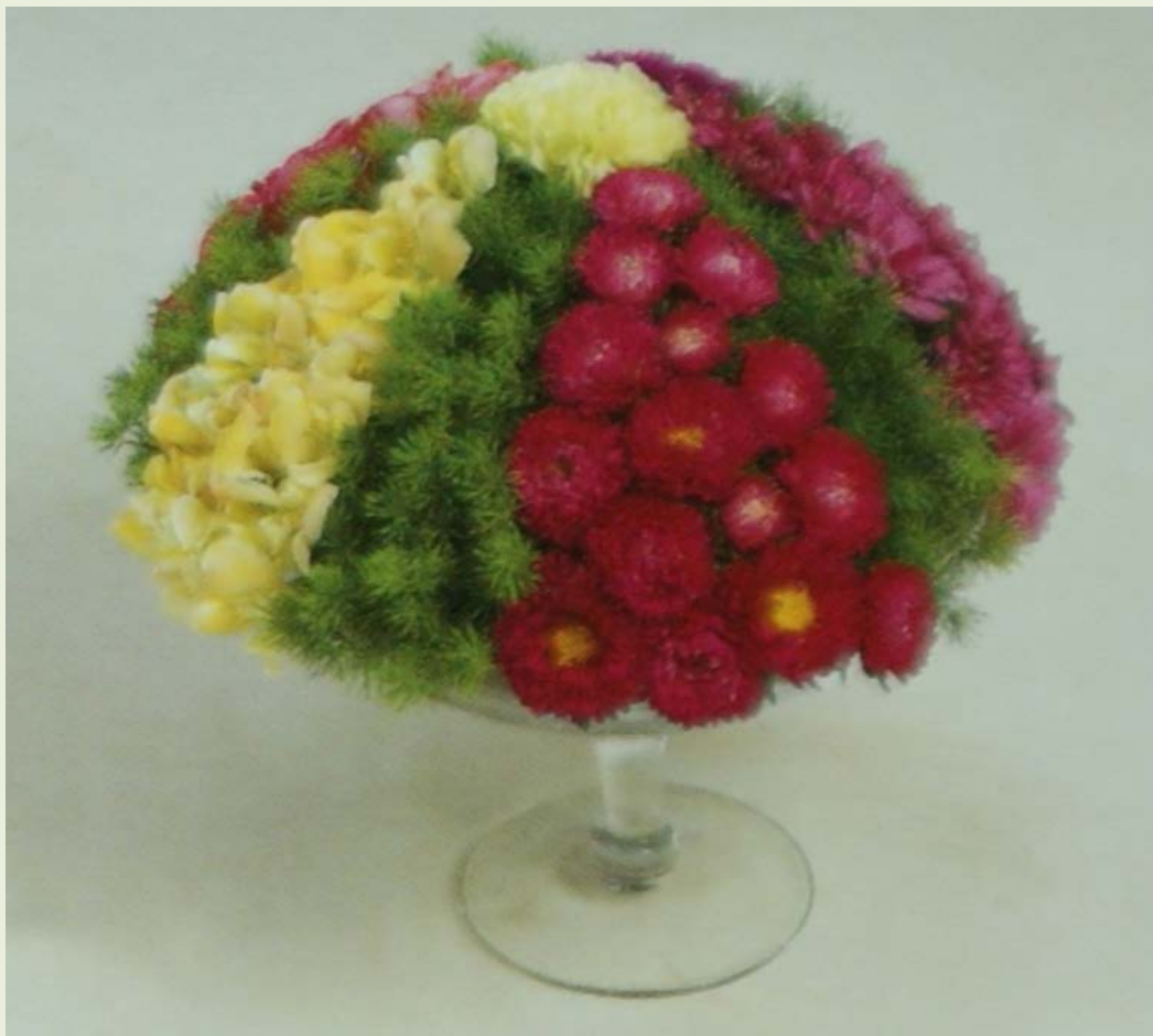
毕德迈尔设计—线条式