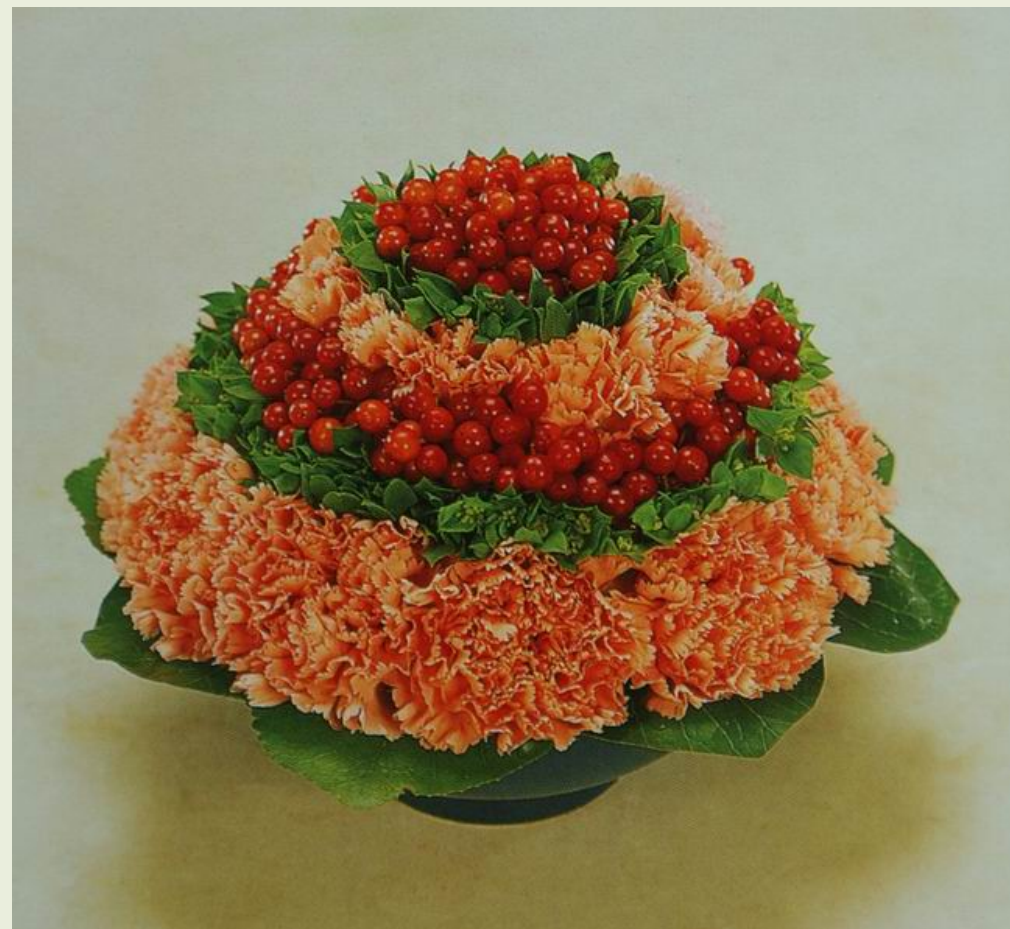
毕德迈尔设计--环状式