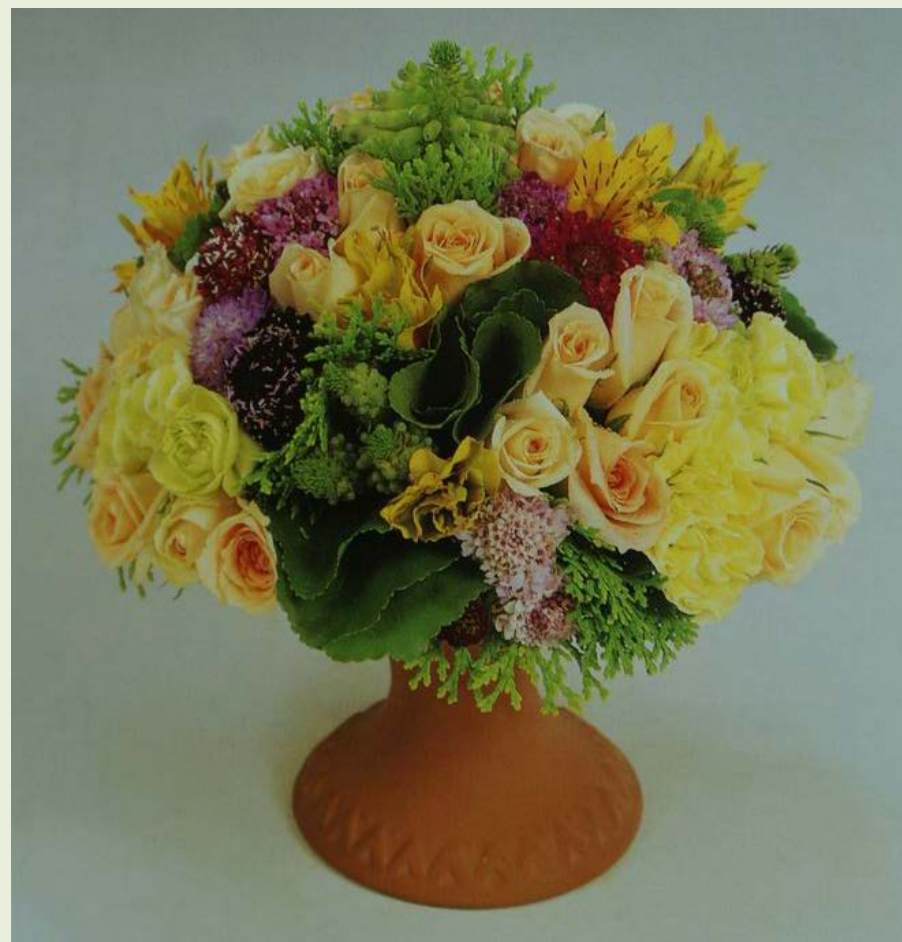
毕德迈尔设计—群聚式